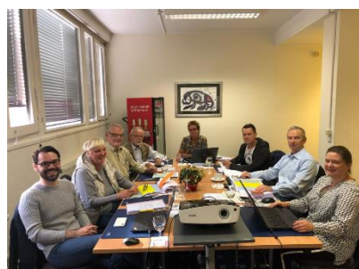
Vergabesitzung für die Ausschreibungsrunde 9.2; Foto: Tafel Deutschland e.V.