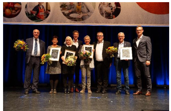
Bekanntgabe der Gewinner beim Zukunftskongress; Foto: Tafel Deutschland e.V.

Die Preisträger können sich über ein Wochenende in Berlin freuen! Den Film zum Geschichtenwettbewerb finden Sie in Kürze auf unserer Website: www.tafel.de